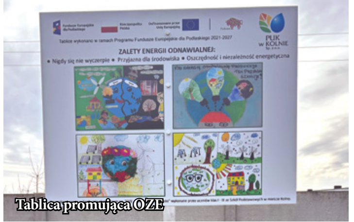
Tablica promująca OZE