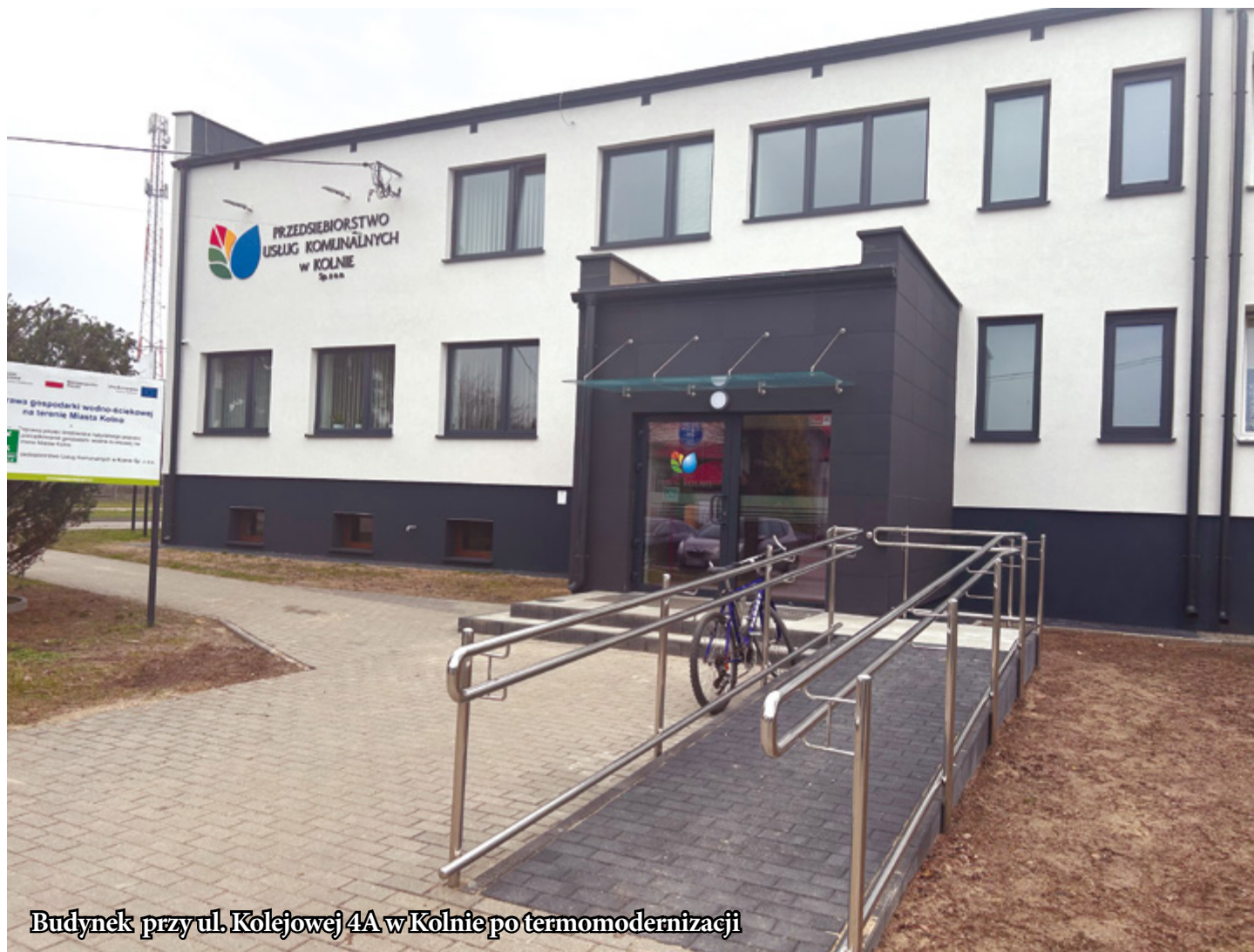
Budynek przy ul. Kolejowej 4A w Kolnie po termomodernizacji

W ramach Projektu zastosowano kompleksowe rozwiązania mające na celu racjonalną i oszczędną gospodarkę zasobami energetycznymi. Działania przyczyniły się do poprawy izolacyjności termicznej obiektów, a dzięki temu zmniejszyły się straty ciepła i zużycie energii dla potrzeb grzewczych. Zmniejszenie zapotrzebowania na energię przyczyni się także do poprawy jakości powietrza oraz redukcji gazów cieplarnianych. Poprawił się bilans cieplny budynków oraz obniżyły koszty utrzymania. Dodatkowo dzięki działaniom edukacyjnym podniesiono świadomości i wiedzę mieszkańców w zakresie wykorzystania OZE i efektywności energetycznej.