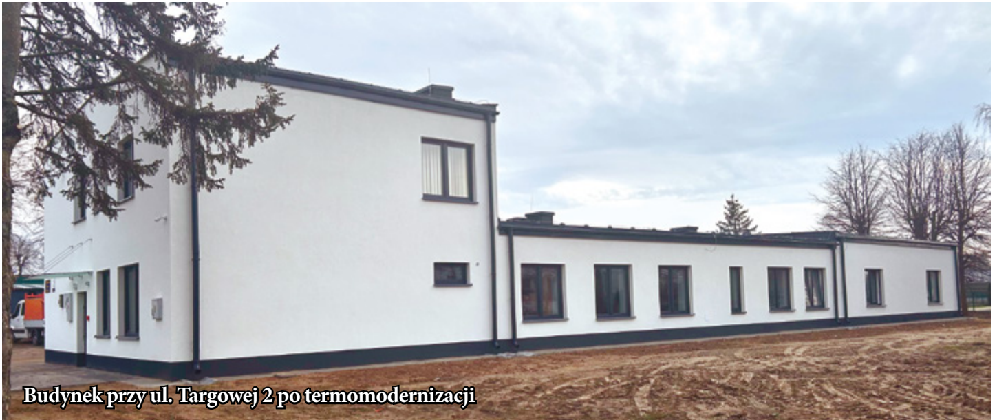
Budynek przy ul. Targowej 2 po termomodernizacji