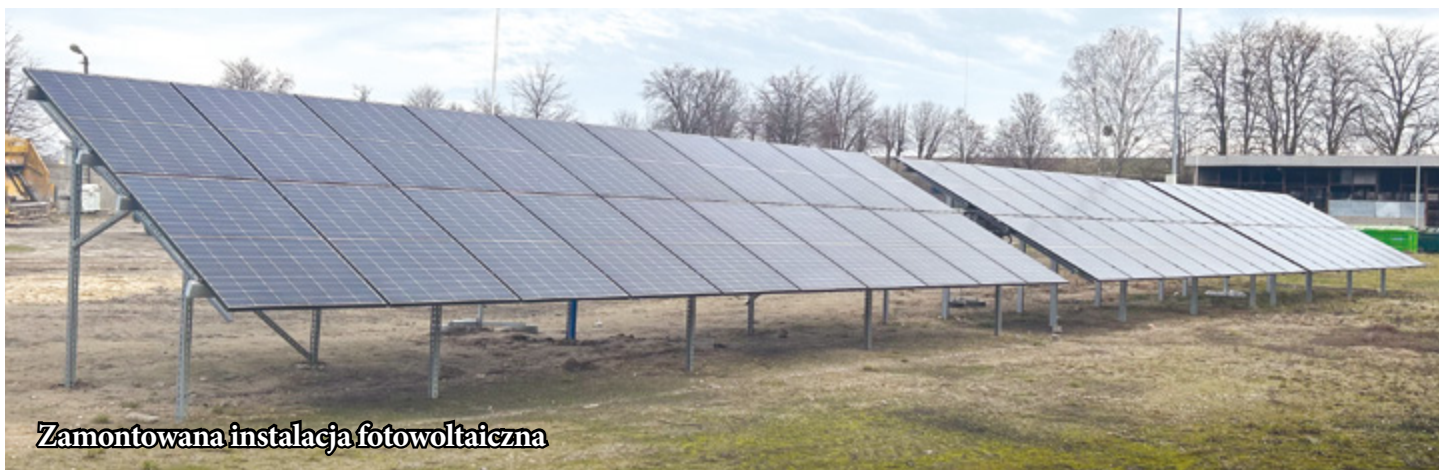
Zamontowana instalacja fotowoltaiczna