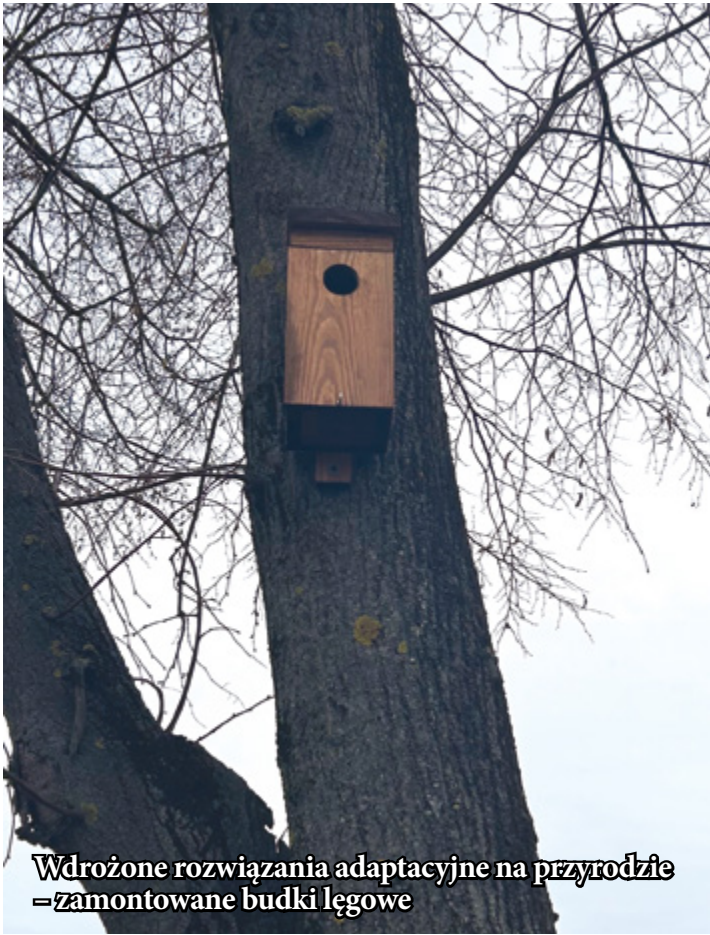
Wdrożone rozwiązania adaptacyjne na przyrodzie = zamontowane budki lęgowe