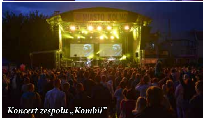
Koncert zespołu „Kombii”