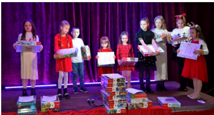
Finałiści „Grabowskiego Kolędowania” w kategorii wiekowej do lat 9-ciu.

Nagrody w konkursie ufundowały Polenergia i BS w Kolnie. Sponsorem serdecznie dziękujemy.