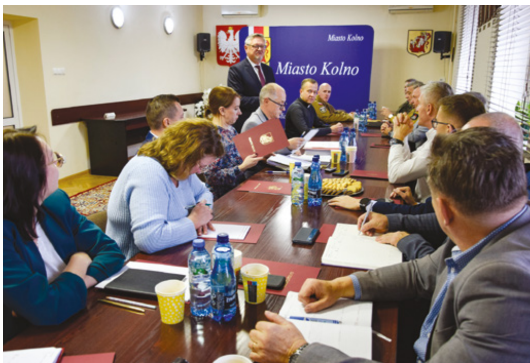
Fotogaleria z wydarzenia dostępna jest na www.umkolno.pl

Opracowanie i zdjęcia: Andrzej Konopka / UM Kolno