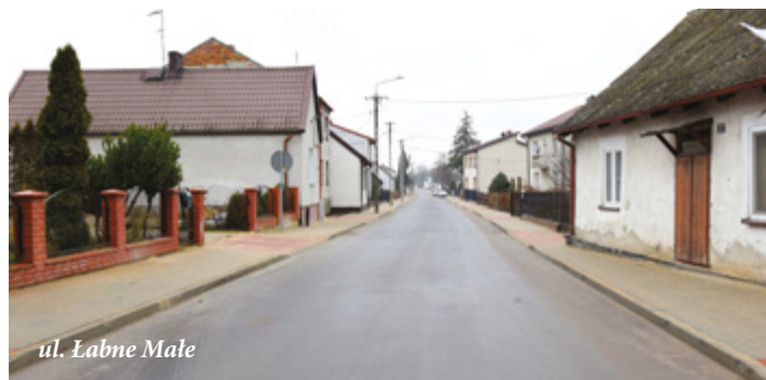
ul. Łabno Małe

W ramach zadania przebudowano ul. Łabno Małe na długości ok. 385 m, przebudowano chodniki, zjazdy o nawierzchni z kostki betonowej. Wybudowano sieć kanalizacji deszczowej o łącznej długości ok. 427 m oraz przebudowano elementy kablowej linii telekomunikacyjnej.