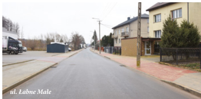
ul. Łabno Małe