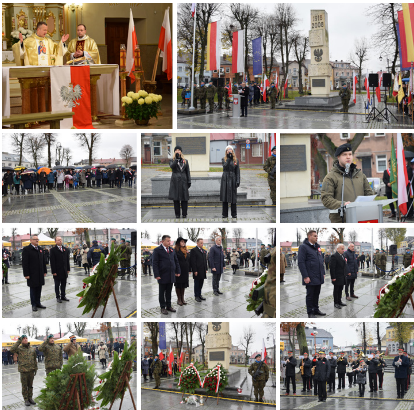
Fotogaleria z wydarzenia dostępna jest na www.umkolno.pl

Tekst i zdjęcia: Andrzej Konopka/UM Kolno