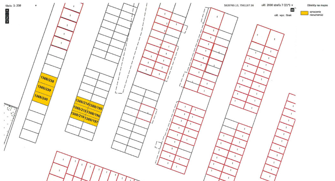
Mapa z lokalizacją działek przeznaczonych do sprzedaży w drodze ustnego przetargu nieograniczonego pod zabudowę garażową

Z uzasadnionej przyczyny przetarg może być odwołany. Szczegółowe informacje dotyczące danych o nieruchomości można uzyskać w Urzędzie Miasta Kolno pokój nr 14 lub pod nr. tel. 86-278-94-54.