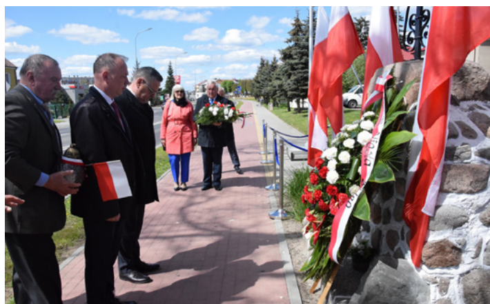
Fotogaleria z wydarzenia dostępna jest na www.umkolno.pl