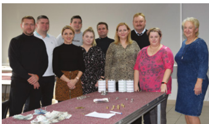
Wolontariusze (nie wszyscy) kwestujący w tym roku.

P o raz kolejny z inicjatywy Towarzystwa Przyjaciół Gminy Grabowo kilkunastu wolontariuszy kwestowało na renowację nagrobka rodziny Wagów, znajdującego się na grabowskim cmentarzu.