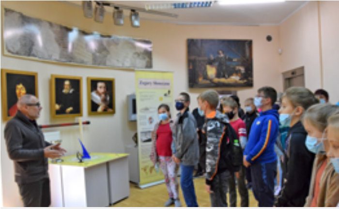
Lekcja w olsztyńskim Obserwatorium Astronomicznym

B iblioteka Publiczna Gminy Grabowo systematycznie realizuje projekt „Od bajek Lema do rzeczywistości”, popularyzujący literaturę Stanisława Lema z jej uniwersalnością i ponadczasowością.