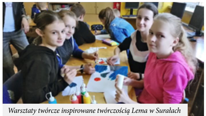
Warsztaty twórcze inspirowane twórczością Lema w Surałach