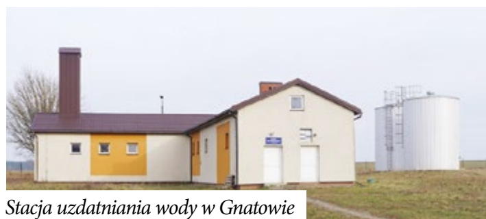
Stacja uzdatniania wody w Gnatowie

Inwestycja polegać będzie na budowie instalacji fotowoltaicznej o mocy elektrycznej 100 kW obejmującej instalację paneli fotowoltaicznych na gruncie wraz z niezbędną infrastrukturą techniczną. Szacowana wartość całości inwestycji to 566 719,94 zł.