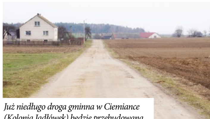
Już niedługo droga gminna w Ciemiance (Kolonja Jadłówek) będzie przebudowana.

Kwotą 200 tys. zł dofinansowano „Przebudowę części drogi gminnej (dz. nr ew. 133 i cz. dz. 134) o dł. ok. 735 m w miejscowości Ciemianka (Kolonja Jadłówek) droga gminna nr 104265B”. Szacunkowa wartość inwestycji to 496.846,00 zł.