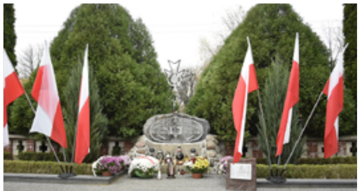
Galeria zdjęć na stronie: www.umkolno.pl