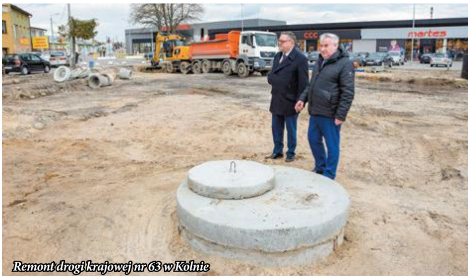
Remont drogi krajowej nr 63 w Kolnie

- Jest dużo niedokończonych spraw, niezaspokojonych potrzeb. Można to ująć tak: pragnę