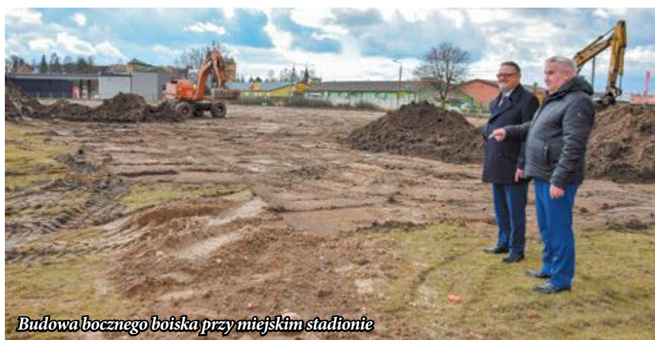
Budowa bocznego boiska przy miejskim stadionie