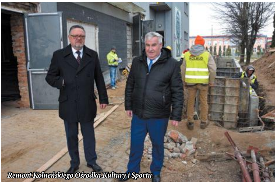
Remont Kolneńskiego Ośrodka Kultury i Sportu

kontynuować starania w obszarze rolnictwa. Z pomocą naszego posła w Parlamencie Europejskim, Krzysztofa Jurgieła, budżet unijny dla rolnictwa polskiego nie powinien być mniejszy. Musimy wygospodarować środki finansowe na zakładanie małych przetwórci surowców rolnych, warzyw i owoców, aby przełamać dyktat cenowy dużych firm z zagranicznym kapitałem. Dalej starać się trzeba o budowę i remonty dróg, zwłaszcza tych lokalnych w regionie