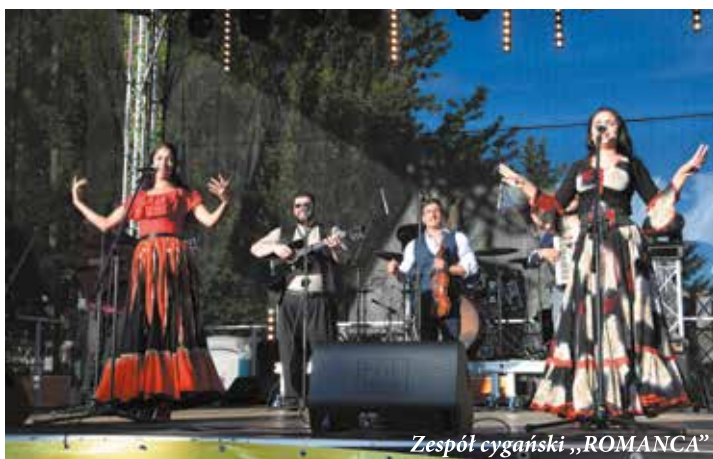
Zespół cygański „ROMANCA”