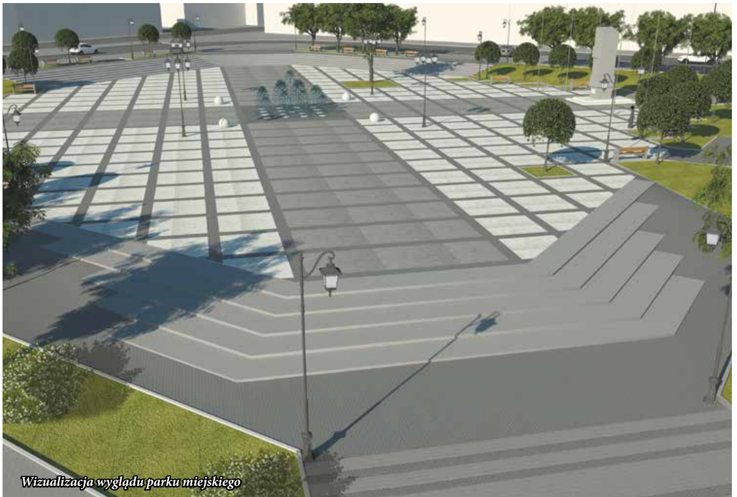
Wizualizacja wyglądu parku miejskiego