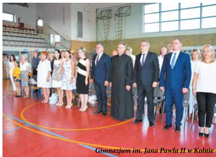
Gimnazjum im. Jana Pawła II w Kolnie