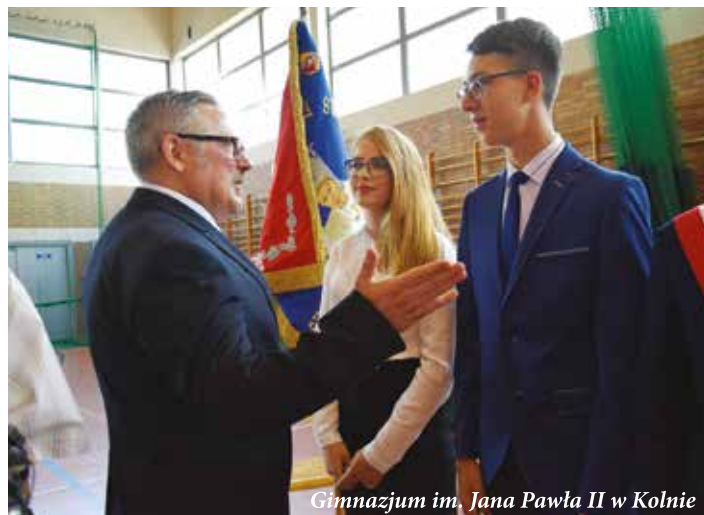
Gimnazjum im. Jana Pawła II w Kolnie