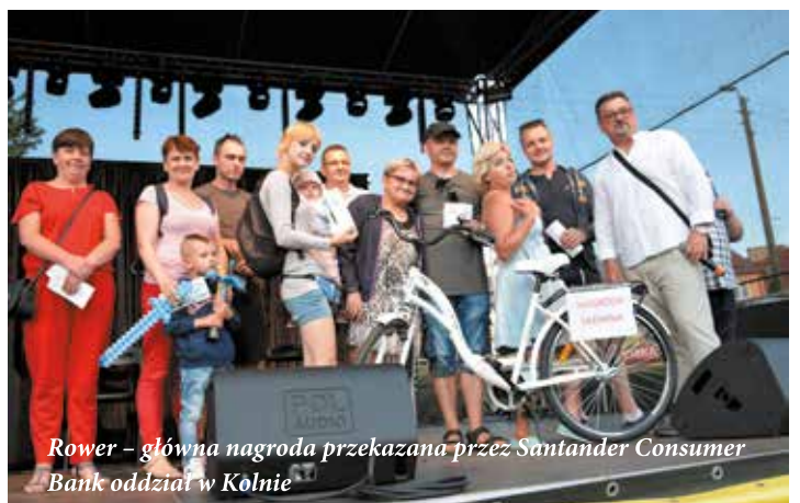
Rower – główna nagroda przekazana przez Santander Consumer Bank oddział w Kolnie