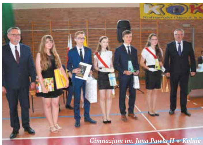
Gimnazjum im. Jana Pawła II w Kolnie