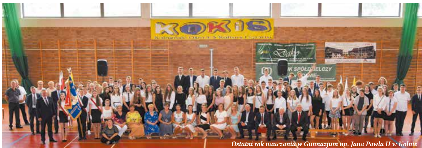
Ostatni rok nauczania w Gimnazjum im. Jana Pawła II w Kolnie

W śród, 19 czerwca uczniowie w całej Polsce rozpoczęli wyjątkowo długie wakacje. Letnia przerwa w nauczaniu potrwa aż 74 dni. Podsumowaniem edukacji w roku szkolnym 2018/2019 były zorganizowane w placówkach oświatowych uroczyste apele.