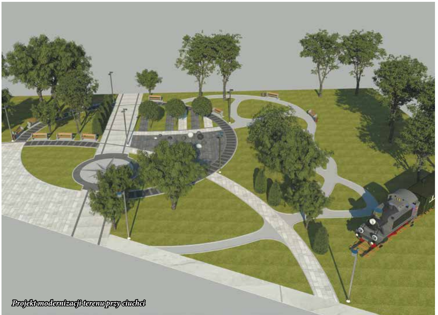
Projekt modernizacji terenu przy ciuchci