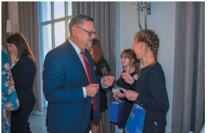
Galeria zdjęć na stronie: www.umkolno.pl