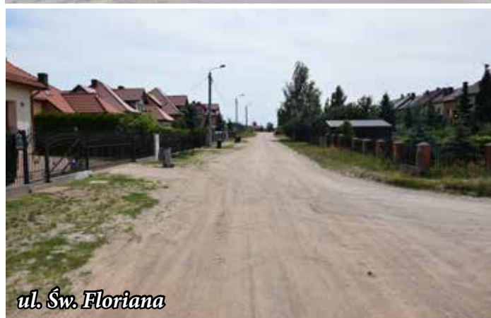
ul. Św. Floriana