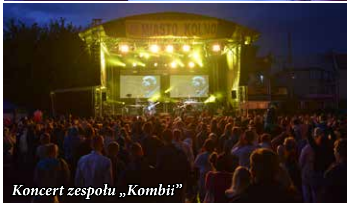
Koncert zespołu „Kombii”