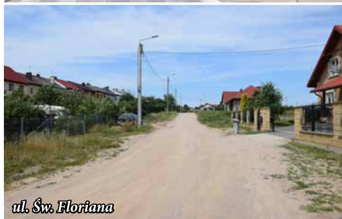
ul. Św. Floriana