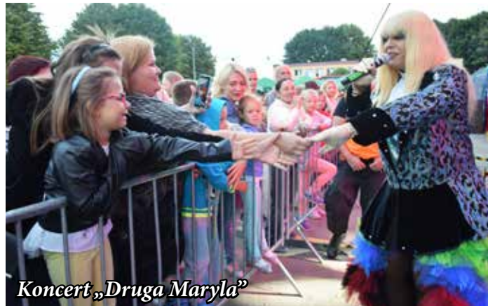
Koncert „Druha Maryla”