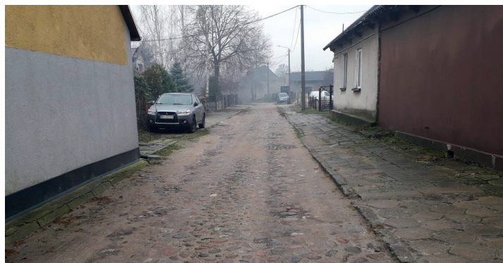
ul. Łazienna przed remontem