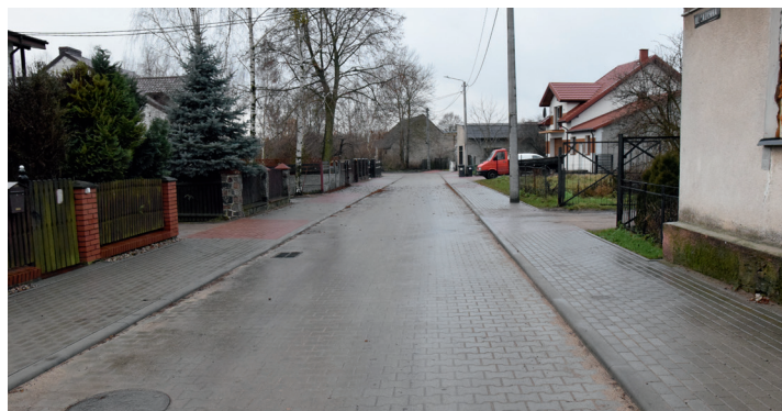
ul. Łazienna po remoncie