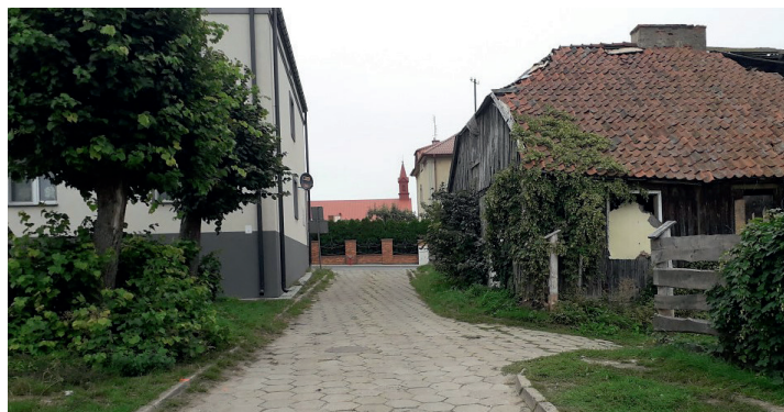
ul. Ogrodowa przed remontem