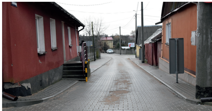
ul. Ogrodowa po remoncie