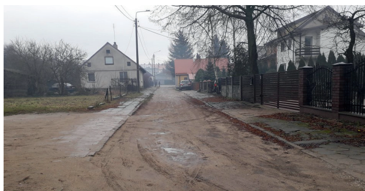
ul. Łazienna przed remontem