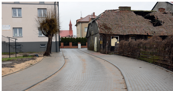
ul. Ogrodowa po remoncie