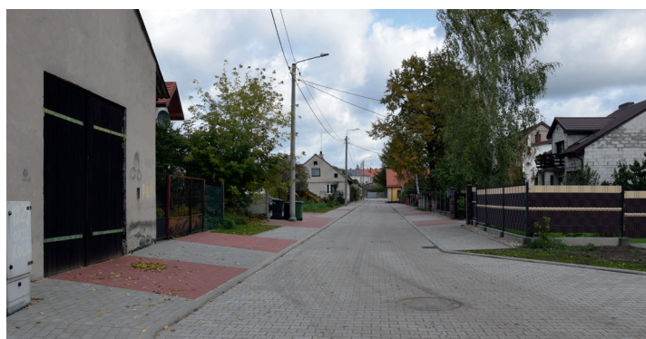
ul. Łazienna po remoncie