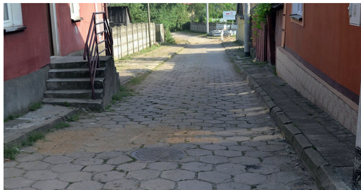
ul. Ogrodowa przed remontem

Prace budowlane zostały zakończone w listopadzie 2022 r. i ulica została oddana już do użytkowania.