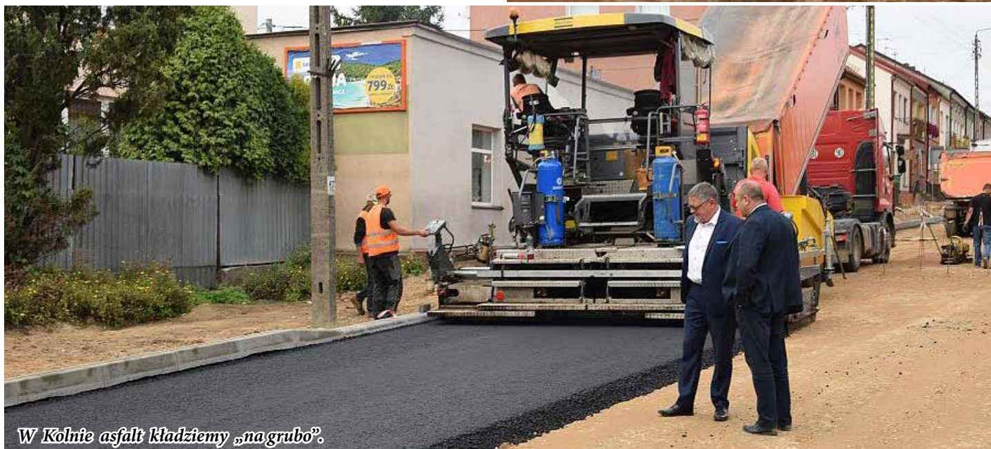
W Kolnie asfalt kładziemy „na grubo”.