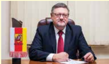
DUDA Andrzej - Burmistrz Miasta Kolno