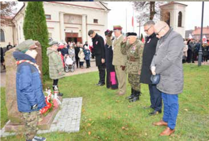
Thuny mieszkańców na miejskich uroczystościach