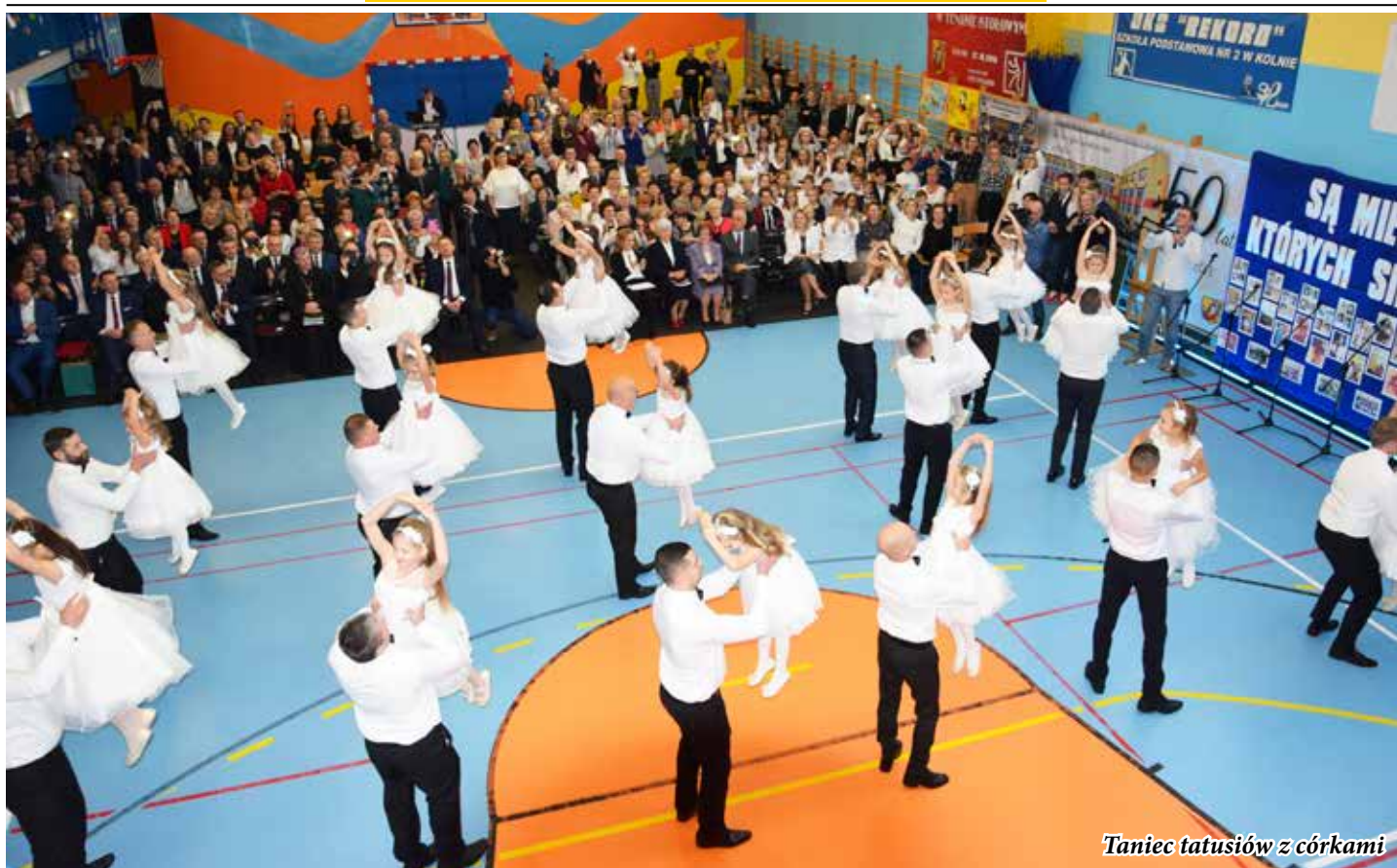
Taniec tatusiów z córkami