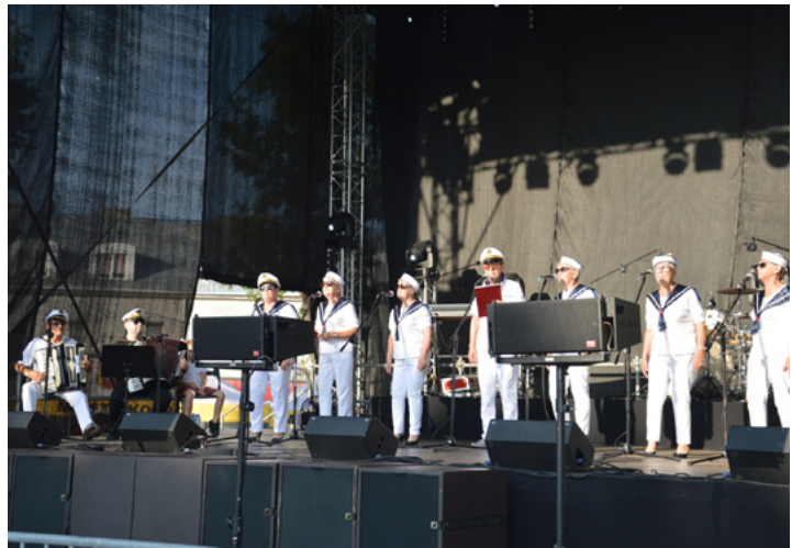
Fotogaleria z wydarzenia dostępna jest na www.umkolno.pl