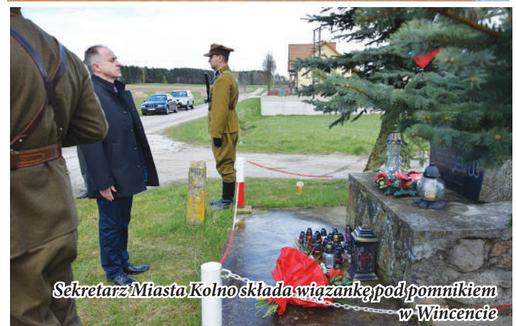
Sekretarz Miasta Kolno składa wiązanke pod pomnikiem w Wincencie