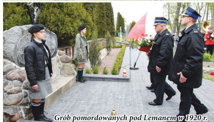
Grób pomordowanych pod Lemanem w 1920 r.

sił zbrojnych. Konstytucja 3 Maja do dziś niesie kilka uniwersalnych przesłań dla Polaków. Jest wzorem politycznego konsensusu pomiędzy zwaśnionymi stronami - mówił burmistrz. - Znaczenie Konstytucji 3 Maja polega również na tym, że w świadomości Polaków upamiętniła się jako symbol niepodległości państwa polskiego, postępu społecznego i przełomu w dziedzinie ustrojowej.