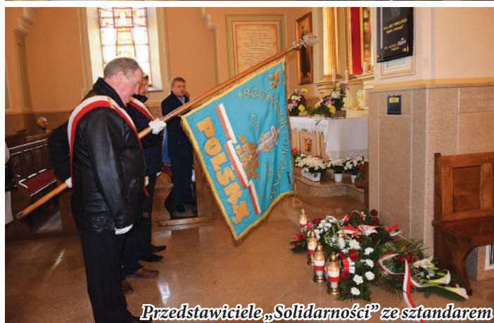
Przedstawiciele „Solidarności” ze sztandarem