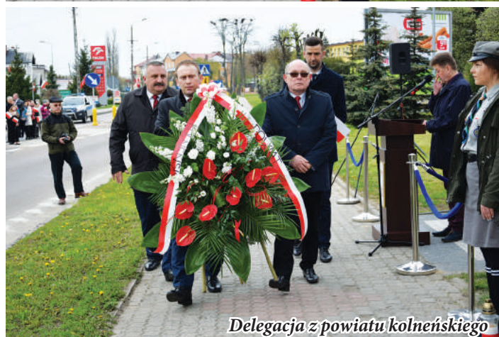
Delegacja z powiatu kolneńskiego