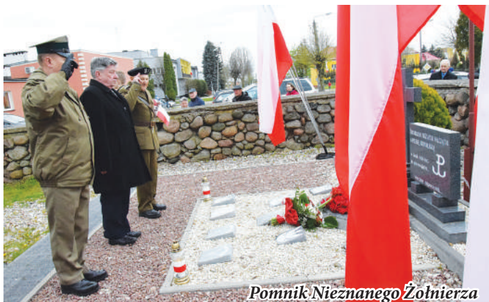
Pomnik Nieznanego Żołnierza

Po odzyskaniu niepodległości naszego kraju uroczyste obchody organizowały władze państwowe i samorządowe. Idee wolnościowe i wyzwolenie, z którymi nieodłącznie kojarzyła się konstytucja, nie podobały się jednak władzom PRL-u. Zakazane i tłumione przez komunistyczny rząd uroczystości powróciły do kalendarza świąt narodowych w 1990 roku.