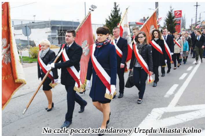
Na czele poczet sztandarowy Urzędu Miasta Kolno