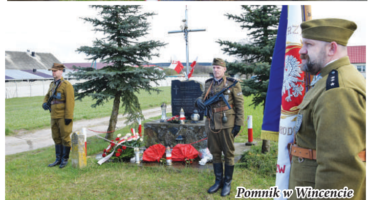
Pomnik w Wincencie