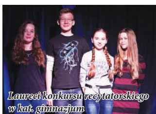
Laureaci konkursu recytatorskiego w kat. gimnazjum