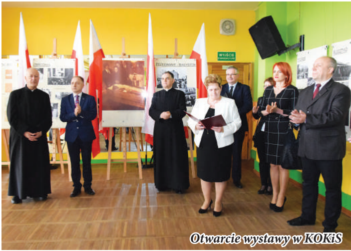
Otwarcie wystawy w KOKiS