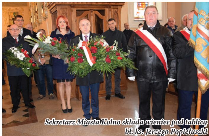
Sekretarz Miasta Kolno składa wieniec pod tablicą bł. ks. Jerzego Popiełuszki