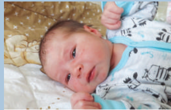
Ciołko, córka Leny, ur. 06.04.2017 r. godz. 8:30