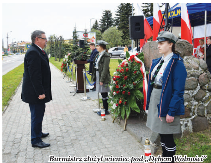
Burmistrz złożył wieniec pod „Dębem Wolności”