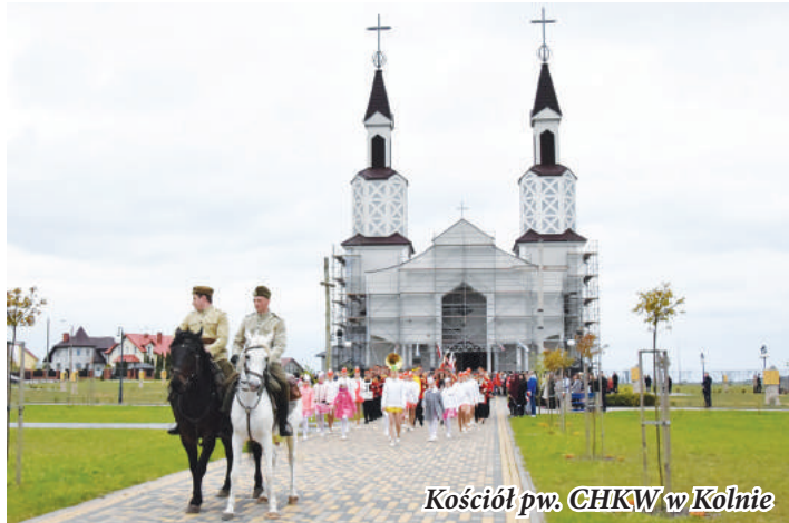
Kościół pw. CHKW w Kolnie