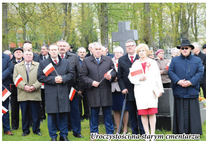
Uroczystości na starym cmentarzu

Przypomniał również podstawowe założenia historycznej Konstytucji. - Konstytucja 3 Maja, która gruntownie zmieniała ustrój Rzeczypospolitej należy bez wątpienia do najpiękniejszych kart naszej historii. Konstytucja wzmacniała suwerenność i stabilność Rzeczypospolitej. Likwidowała liberum veto i wprowadzała ponownie monarchię dziedziczną. Twórcy ustawy zadbali też o reformę wymiaru sprawiedliwości, miastom nadali nowe prawa, przyznając stanowi mieszczańskiemu nowe prawa i obowiązki. Pod opiekę „prawa i rządu krajowego” wzięli ludność wiejską. Powołując armię, stworzyli fundament pod budowę nowoczesnych