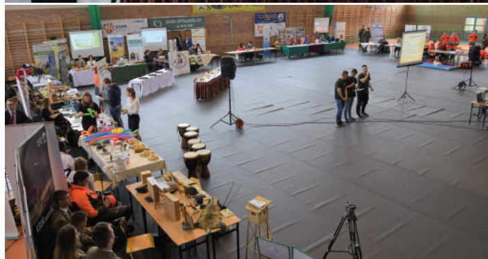
Galeria zdjęć na www.umkolno.pl