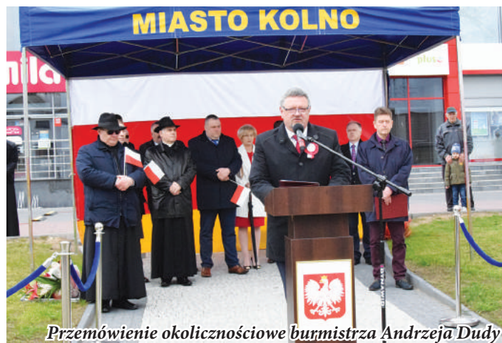
Przemówienie okolicznościowe burmistrza Andrzeja Dudy

Pamięć o Konstytucji przetrwała mimo narodowych zawirowań. Łączyła podczas masowych demonstracji w 100. i 125. rocznicę jej uchwalenia, które przypominały o utraconej państwowości.