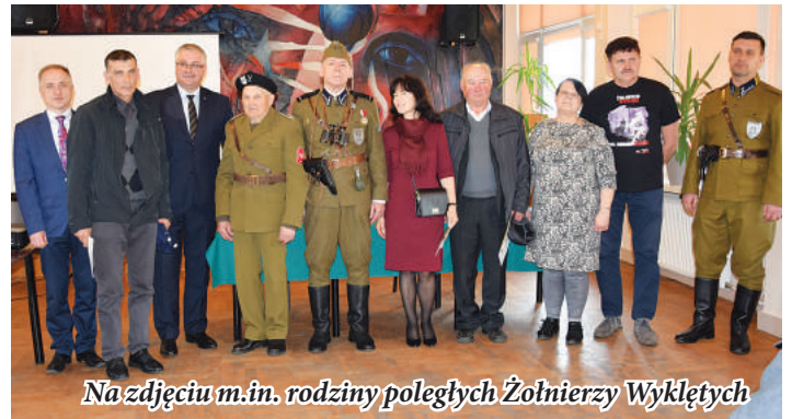
Na zdjęciu m.in. rodziny poległych Żołnierzy Wyklętych