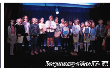
Recytatorzy z klas IV- VI