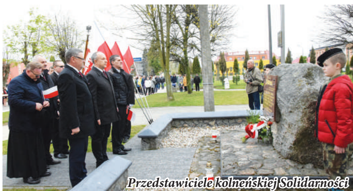
Przedstawiciele kolneńskiej Solidarności