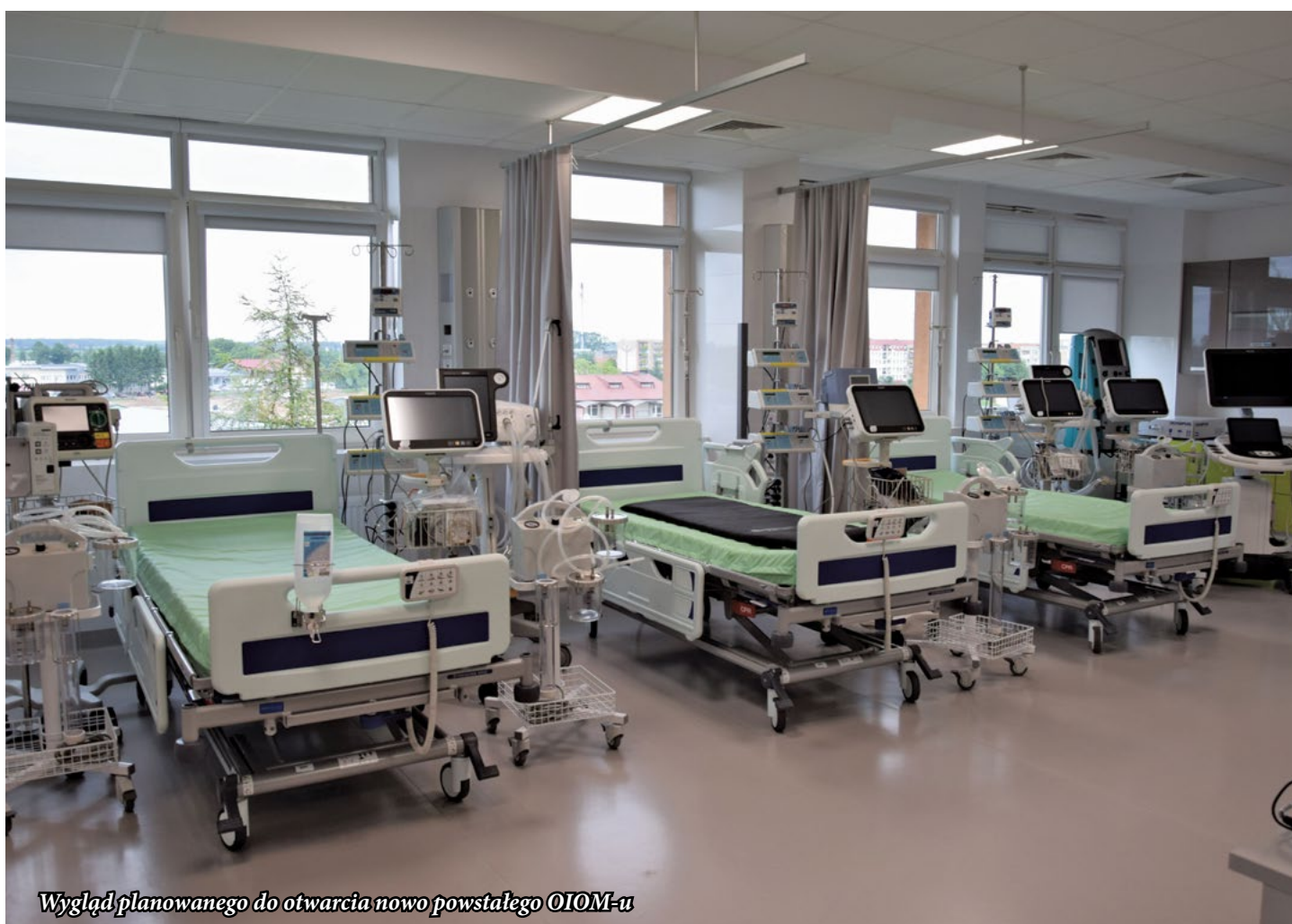
Wygląd planowanego do otwarcia nowo powstałego OIOM-u